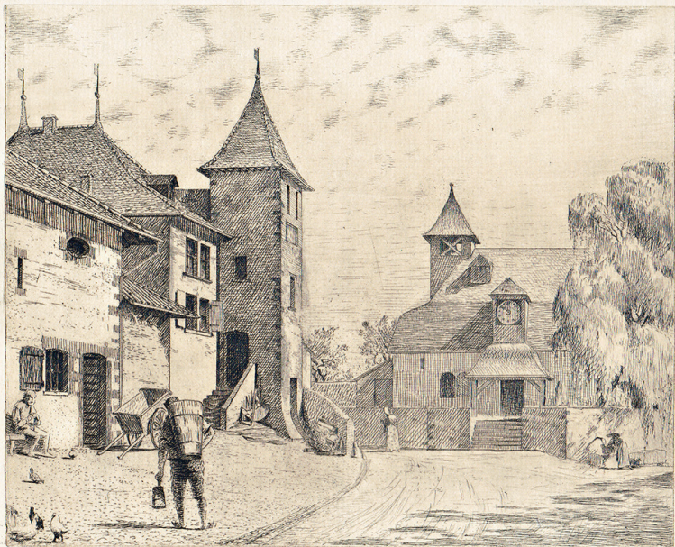
Gravure à l'eau forte, le Château et le temple avant 1868